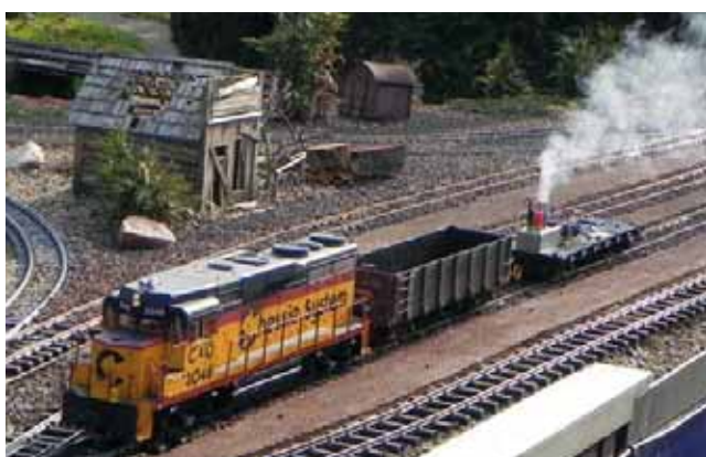
Modellbau: Eigenbau eines Hochleistungs-Raucherzeugers 24