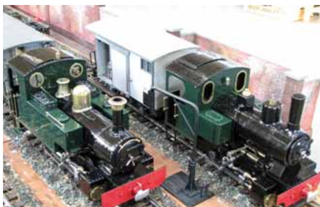
Live Steam: RIVERDALE Kohle-Loks 18