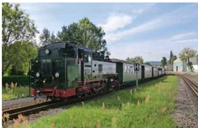
Vorbild: Die Zittau-Oybin-Jonsdorfer-Eisenbahn 4