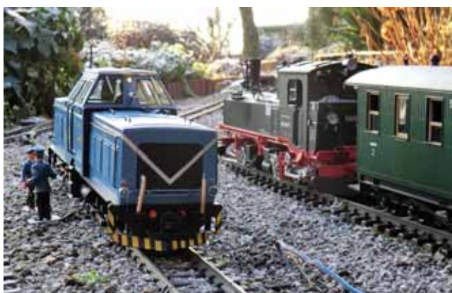
Modellbau: Das Keilriemenwunder 34