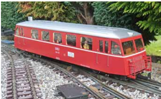
Dänischer „Skinnebus“. (Seite 30)