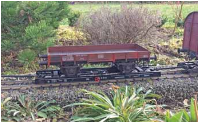
Rollwagen der HSB aus Teilesatz. (Seite 25)