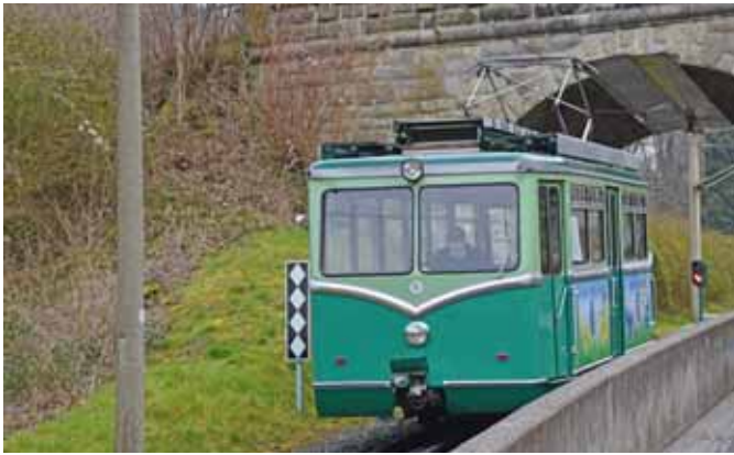
Die Drachenfelsbahn in Königswinter. (Seite 4)