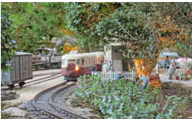
Außenanlage Made in France. (Seite 34)