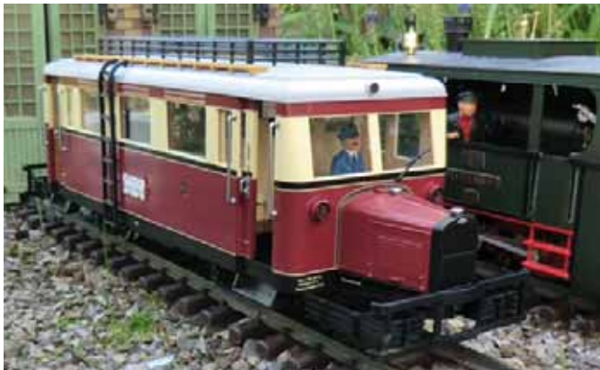
Neuheit von MLGB ausgeliefert – Schienenbus T41 (Seite 50)