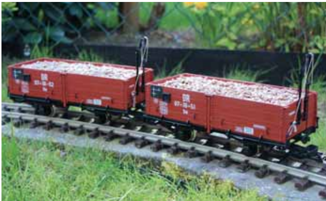
Ein Rübenwagen aus dem Drucker. (Seite 24)