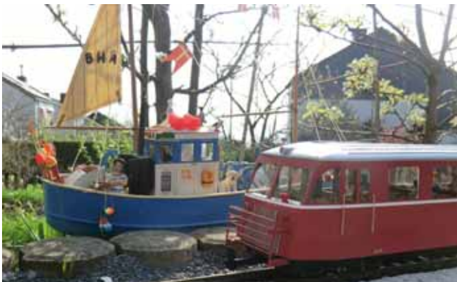
Außenanlage auf kleinem Platz. (Seite 38)