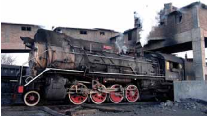
Dampfender Reisebericht aus China. (Seite 4)