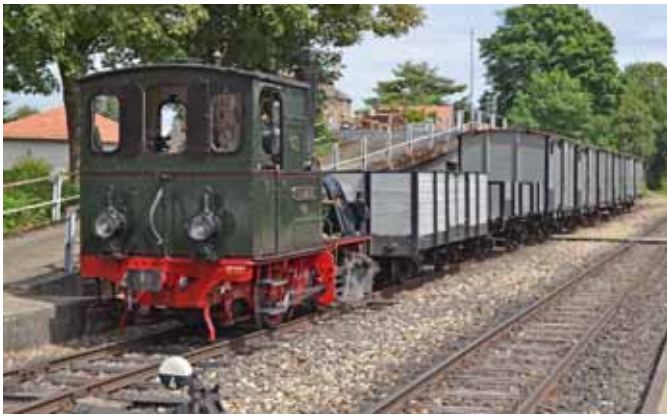
Ein Besuch bei der Selfkantbahn. (Seite 12)