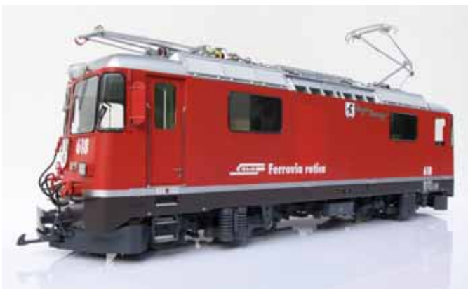
Wir stellen vor. (Seite 42)