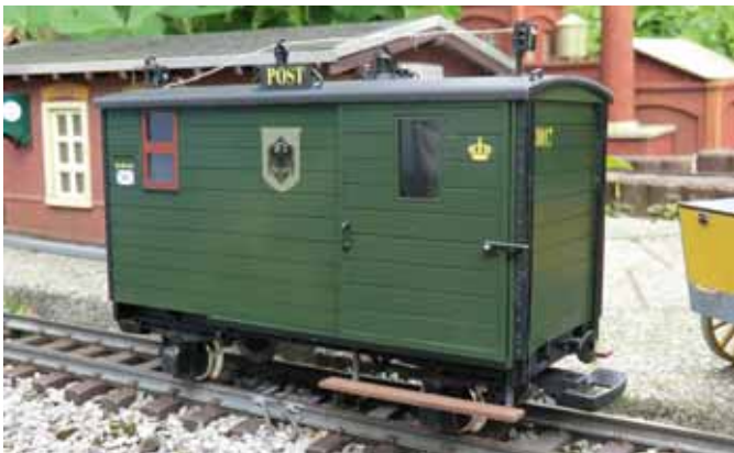
Die Post ist da. (Seite 16)