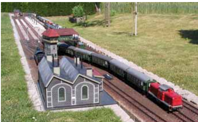
Außenanlage in Spur I. (Seite 28)