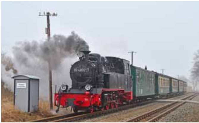
Winterdampf bei der RüBB. (Seite 4)