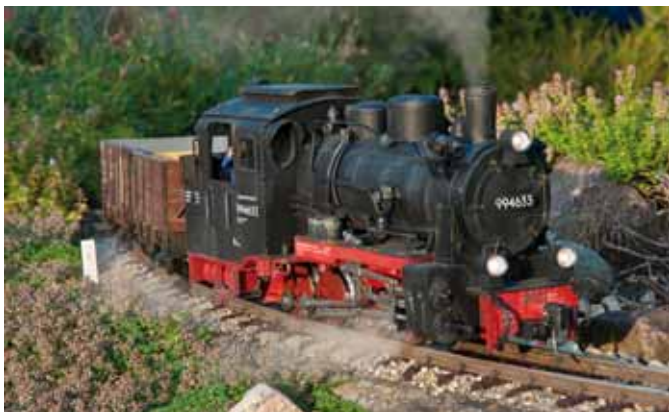
Digitalumbau der Rügendampflok 994633. (Seite 20)