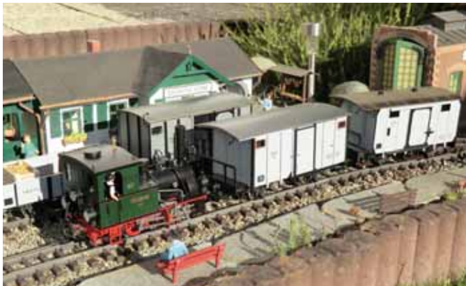
Güterwagen für den Lenz-Güterzug. (Seite 14)