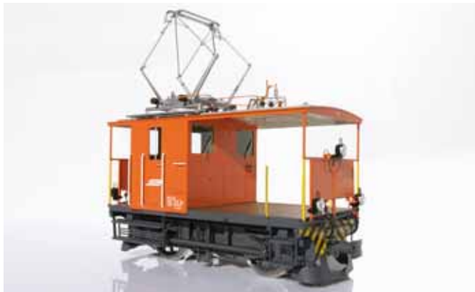
RhB-Rangiertraktor Te 2/2 von KISS. (Seite 45)