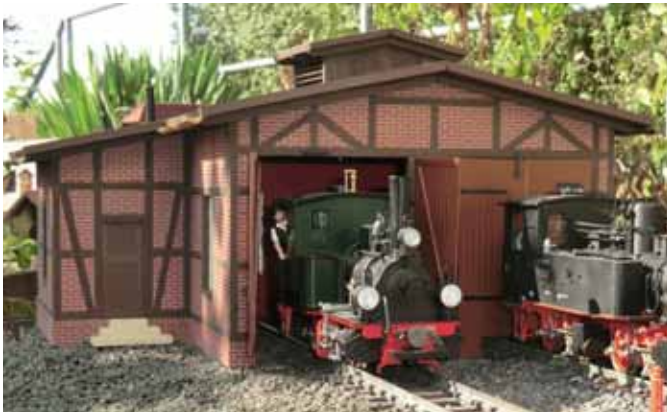
Geräumiger Unterstand für Loks. (Seite 24)