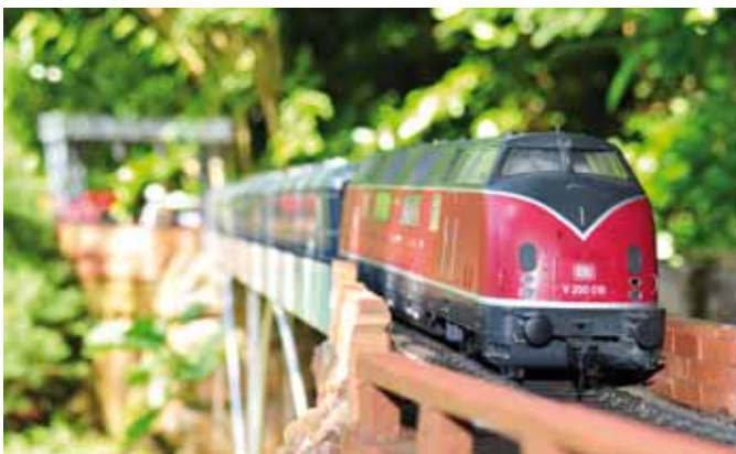
Spur-1-Anlage im Odenwald. (Seite 27)