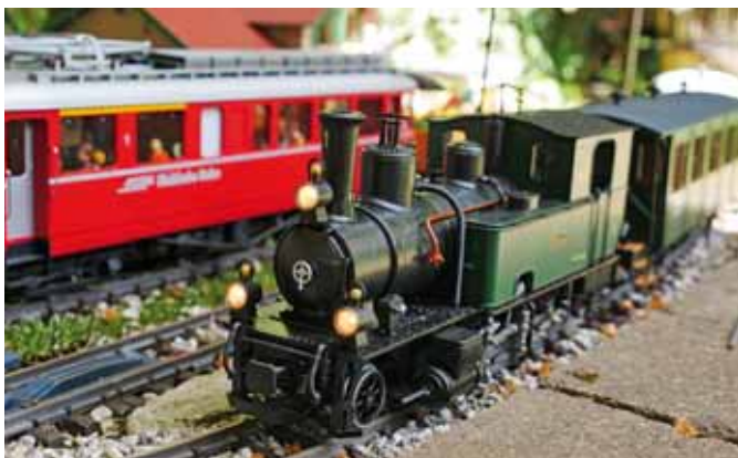
Die Amselbahn – ein Update dieser Außenanlage. (Seite 34)

Titelbild: Echtdampflok Porter von KM1 beim Test