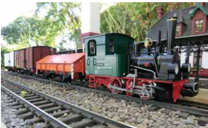
Vorge stellt: der „Fabrikzug“ von LGB. (Seite 44)