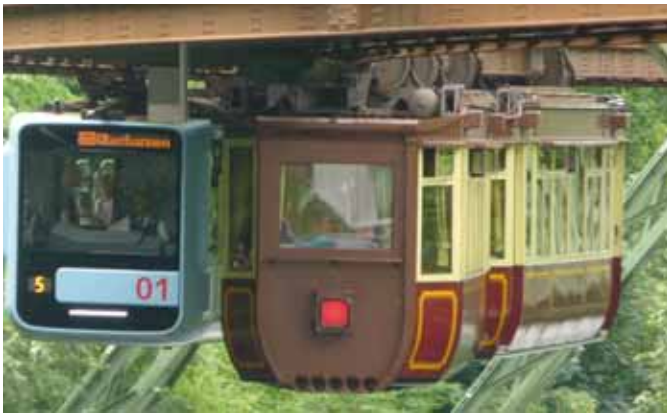
Bahn in der Schwebe. (Seite 4)