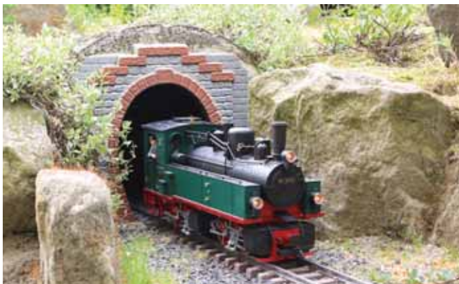
Harzbahn in der Pfalz. (Seite 34)