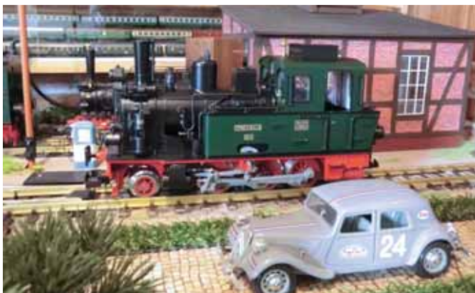
„SPREEWALD“ von LGB. (Seite 39)