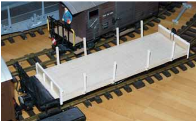
Eigenbau-Rungenwagen der Biasca – Acquarossa Bahn. (Seite 12)