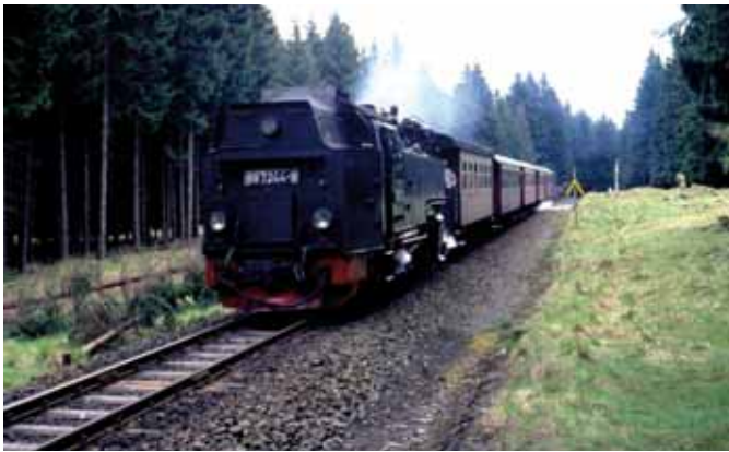
Zu Besuch bei der Harzquerbahn. (Seite 6)