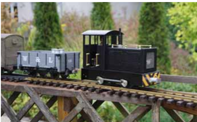
Boulton von MAMOD – Umbau zur RC-Akku-Lok. (Seite 24)