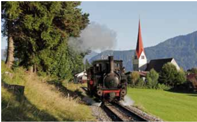
Die Achenseebahn. (Seite 4)