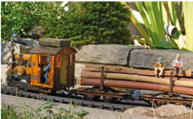
Feldbahnlok im Eigenbau. (Seite 23)