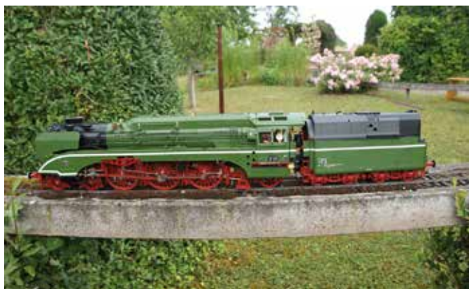
„Jimmo“ der grüne Renner in Spur I. (Seite 34)