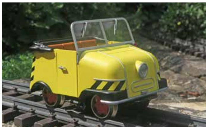
Schienentrabi (Seite 46)

Titelbild: Re6/6 in Spur 0 auf der schweizer Außenanlage