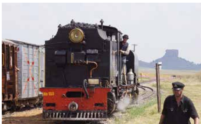
Reisebericht aus Südafrika. (Seite 4)