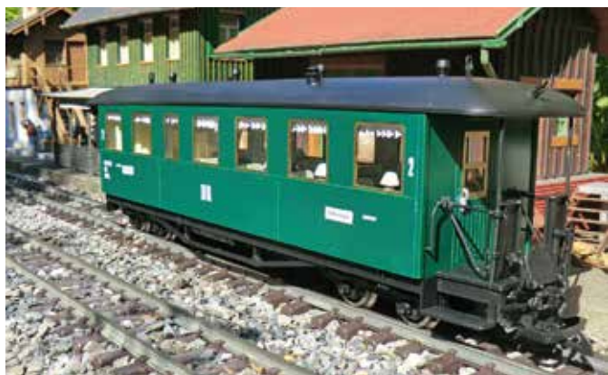
Rügen-Bufferwagen. (Seite 25)