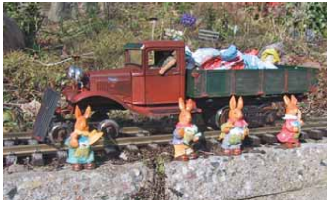
Eine „Goose“ im Eigenbau. (Seite 18)