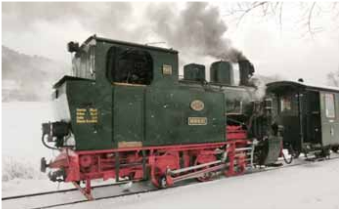
Nikolausdampf. (Seite 4)