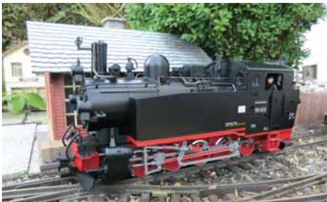
VIK von MLGB. (Seite 24)