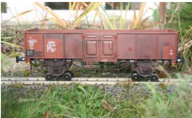
Ommu 40.0 – gesupert. (Seite 40)